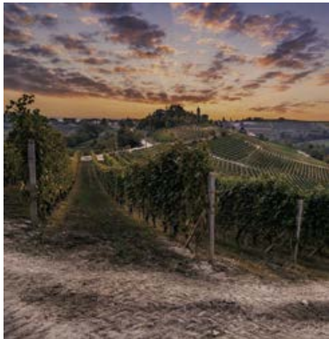
Fabio Tutino → All roads lead to Treiso