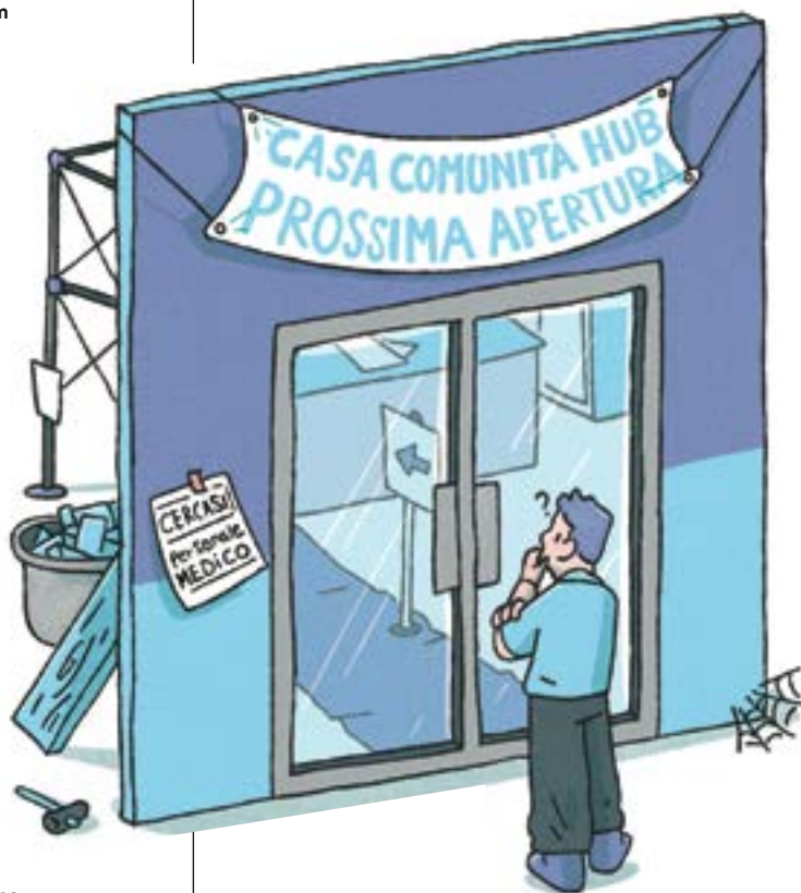
Illustrazione di Giovanni Gastaldi

Il report non tiene poi conto della riduzione del 30 per cento degli interventi da finanziare con le risorse del Pnrr entro il 2026, determinata dall'aumento dei costi. Lo stesso piano afferma che le strutture cancellate saranno realizzate con risorse provenienti dai fondi sull'edilizia sanitaria. Ma le Regioni preannunciano ostacoli su questa strada ●