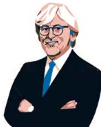
di Alberto Oliveti Presidente della Fondazione Enpam

Quanto sarebbe bello che nell'esercizio della professione medica il genere venisse considerato, sempre, esattamente come il colore degli occhi del chirurgo che ti deve operare: indifferente ●