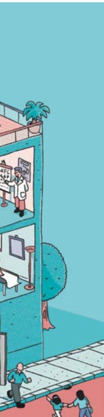
Illustrazione di Giovanni Gastaldi